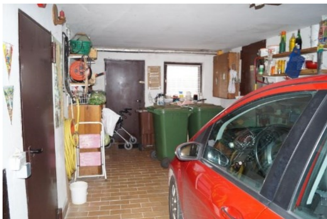
Garage 1 mit Zugang zum Garten