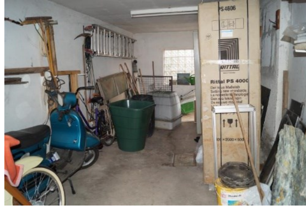
Garage 2 mit Zugang zum Garten