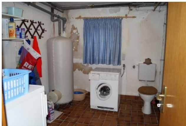
Waschküche mit separater Toilette