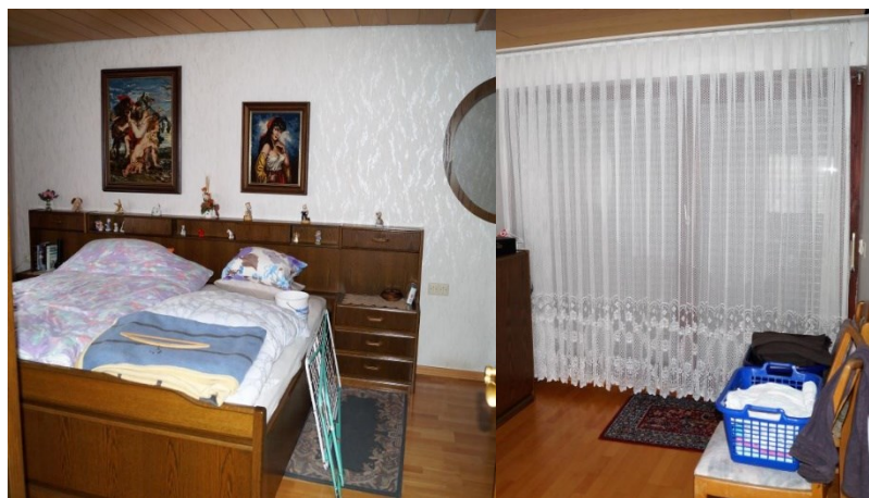
Schlafzimmer mit Zugang zum Balkon