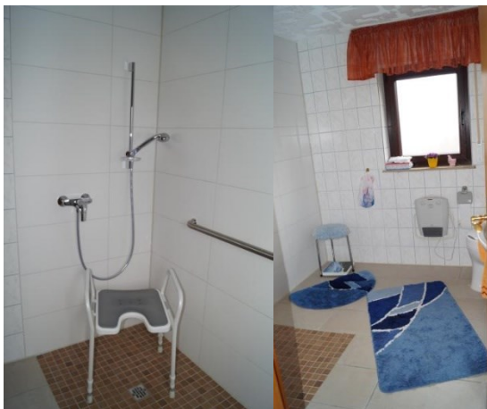
Tageslichtbad mit bodentiefer Dusche