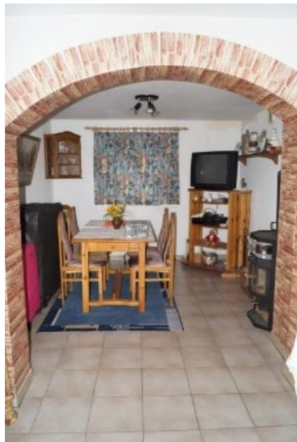
Hobbyraum / Kinderzimmer